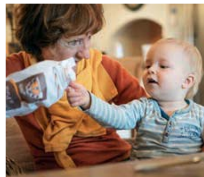
Die Bevölkerung altert rasch: Ab etwa 2030 leben mehr Personen im Rentenalter als 0- bis 19-Jährige im Kanton.

(Gesamtverkehrsmodell des Kantons Zürich) sowie die Planung im Gesundheits- und im Bildungswesen (Spitäler, Alters- und Pflegeheime, Schulen) genannt. Das Prognosemodell des Statistischen Amtes ist ausgelegt für die Zürcher Regionen, liefert aber grundsätzlich auch Ergebnisse auf Gemeindeebene. Die Prognosezahlen können somit auch für die kommunale Infrastrukturplanung dienen, selbst wenn die Unsicherheiten bei kleinräumigen Prognosen, wie auch mit längerem Zeithorizont, zunehmen. Die Zahlen geben nicht nur Hinweise auf die mögliche künftige Einwohnerzahl, sondern auch auf die absehbare Veränderung der Altersstruktur. Interessierte Gemeinden respektive Personen können die Prognosedaten beim Statistischen Amt für Planungszwecke bestellen. Die Prognosedaten sind kostenpflichtig.